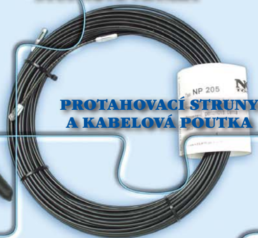
PROTAHOVACÍ STRUNY A KABELOVÁ POUTKA