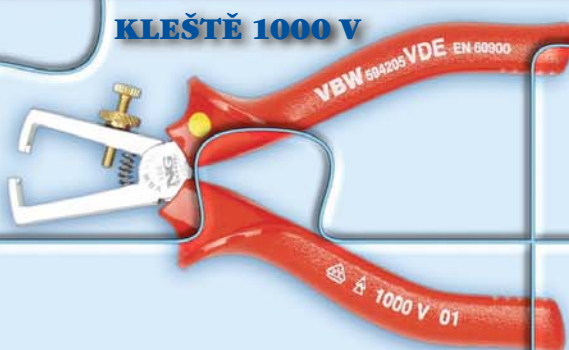
KLEŠTĚ 1000 V