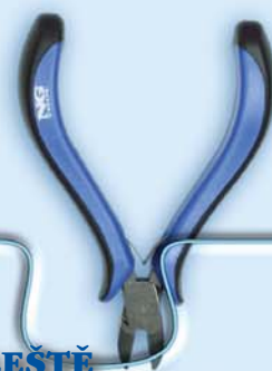
KLEŠTĚ PRO ELEKTRONIKY