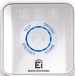
Ei450 regulátor alarmu