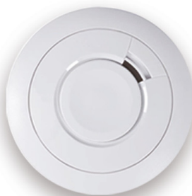
Ei650iC hlásič dymu