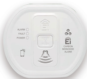
Ei208W hlásič CO